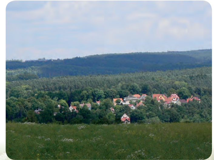
Blick auf Stadtroda