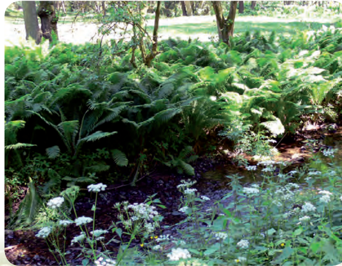
Bachlauf im Zeitzgrund