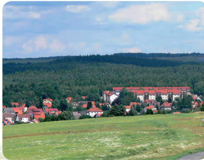
Blick zur Schönen Aussicht