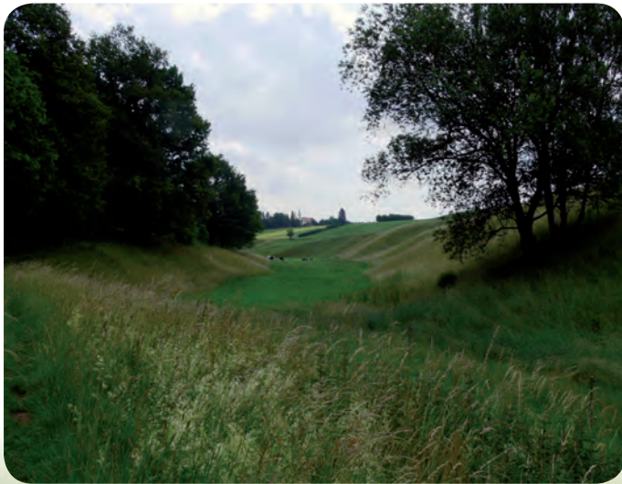
Blick nach Tissa