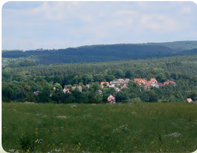
Blick auf Stadtroda

Sie folgen weiter geradeaus dem Hauptweg und der Markierung „Rundwanderweg 2-Hainbücht“. Auf der Mitte des „Leusebeils“ biegen Sie links ab und laufen den Berg hinab nach Hainbücht. In Hainbücht angekommen, laufen Sie im Ort nach rechts und nehmen den Radweg in Richtung Stadtroda. Der Weg führt an dem „Hotel Hammermühle“ vorbei und Sie kommen auf die Hauptstraße von Stadtroda. Sie laufen rechts für ca. 1 km ins Stadtzentrum und beenden am Rathaus Stadtroda Ihre Tour.